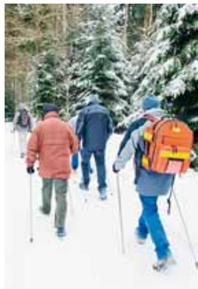
Reha-Teilnehmer beim Trainieren