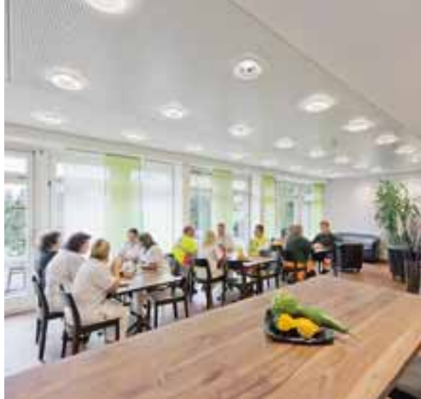
links: Küchenteam rechts: Café-Restaurant «Antere»

Im neu gestalteten Café-Restaurant «Antere» berichten Markus Lüdi, ärztlicher Leiter, und Oliver Schlupe, Bereichsleiter Hotellerie, über den Umbau und das erweiterte Angebot. Holz und helle Farben sorgen für ein warmes Ambiente im Lokal. Unterstrichen wird die angenehme Atmosphäre durch eine dezente Beleuchtung und Schaldecken. Die gemütliche Lounge und eine Gartenterrasse laden zum Verweilen ein.