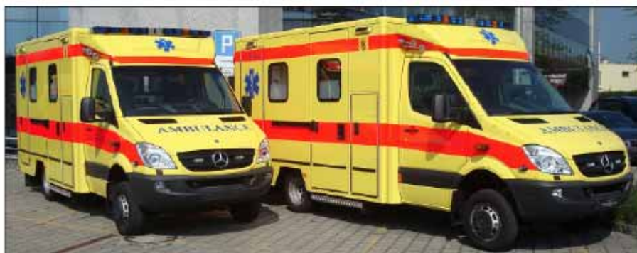
Zwei neue Rettungsfahrzeuge mit Wechselkofferaufbau der SRO AG an den Rettungsdienst-Standorten Huttwil und Niederbipp im Einsatz, Mercedes-Benz Sprinter 519 CDI 4x4, V6-Turbo-Diesel 190 PS, Luftfederung hinten, Gesamtgewicht 5300 kg

Jedes durch Fahrtec aufgebaute Ambulanz-Wechselkoffersystem ist umsetzbar. Dies kann innerhalb der Modellreihe aber auch ausserhalb der Modellreihe mit Hilfe eines Zwischenrahmens erfolgen. Damit können Ressourcen in der Umwelt gespart werden.